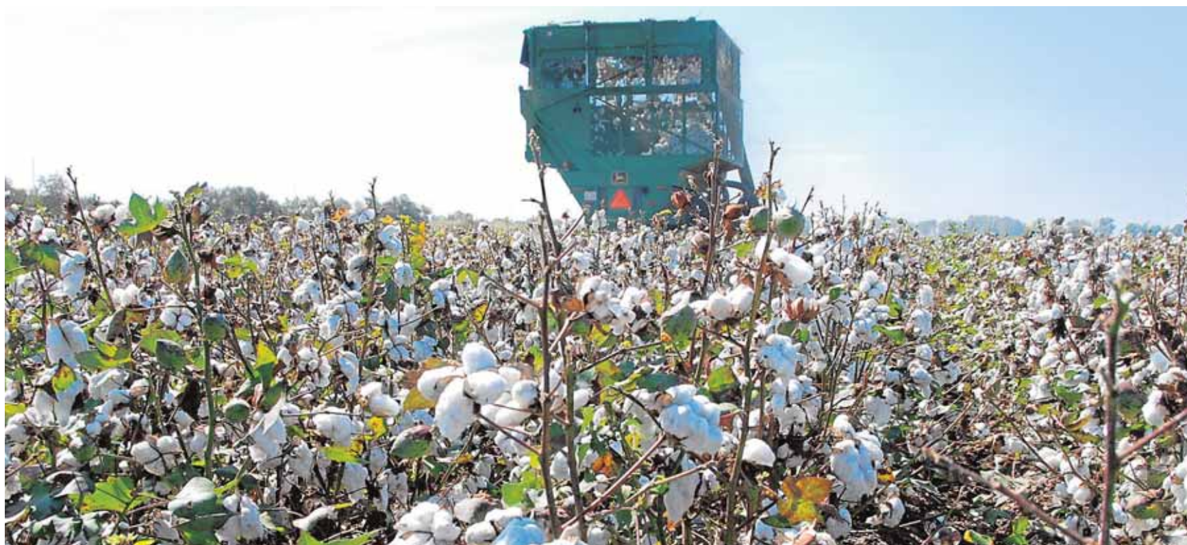
La recolección del algodón en octubre llena de actividad los campos y las poblaciones tradicionalmente algodoneras.

na tendrá lugar a las doce de la noche en los aparcamientos del recinto ferial, para a continuación pasar a la celebración de la Velá de San Juan 2015, que contará con actuaciones musicales, en los aparcamientos del antiguo Hiper Valme. A.H.