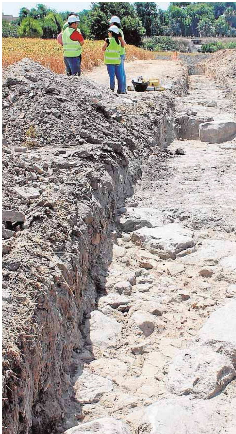
Parte del yacimiento romano descubierto en el Lavadero de Marchena

Proceso de identificación Se han parado los trabajos para la mejora de las conducciones de agua en un tramo de 200 metros