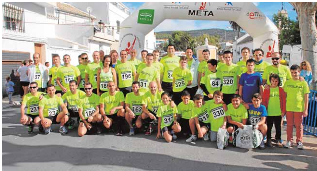
Socios del club de corredores ursaonenses Atletas D'Elite tras una competición en la provincia

Con la intención de federar el club en los próximos meses, teniendo en cuenta las excelentes marcas obtenidas, Atletas D'Elite se encuentra preparando la carrera de la Velá de Fátima que tendrá lugar mañana viernes, dentro de las actividades que para esta festividad se encuentran previstas, así como en la preparación de lo que será el evento del año: el II medio maratón «Villa Ducal de Osuna» que, para el domingo 4 de octubre de 2015, cuenta ya con la participación de alrededor de 500 corredores.