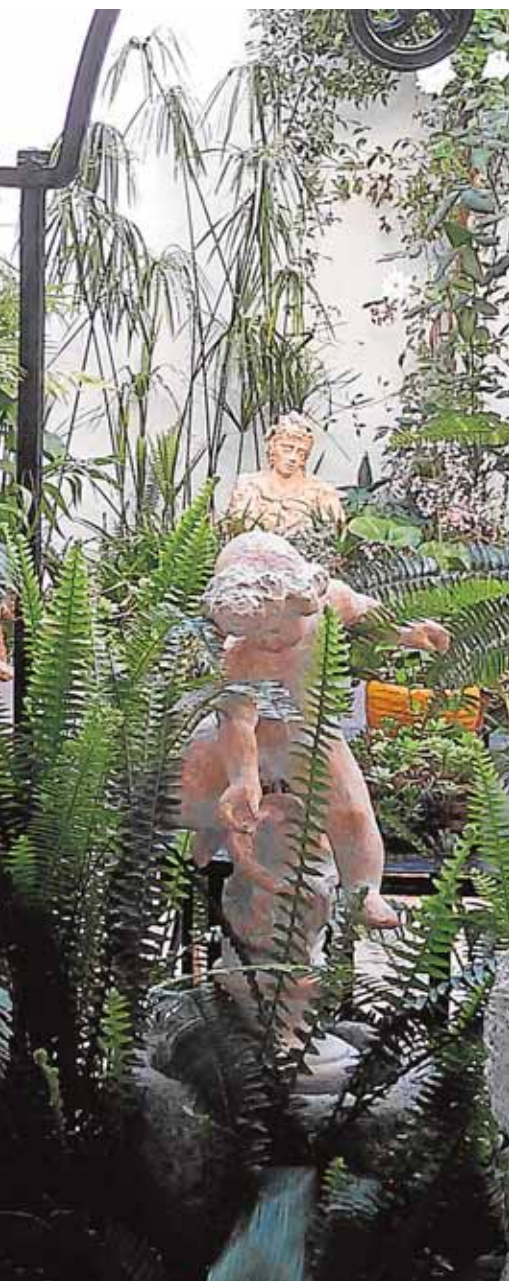
...mas esculturas que ha realizado BORJA MORENO

a todos aquellos niños que quieren permanecer activos tras la llegada de las vacaciones escolares. En el campamento se realizan gymkanas, actividades de reciclaje y medio ambiente, juegos que fomenten la solidaridad y natación. B.M.