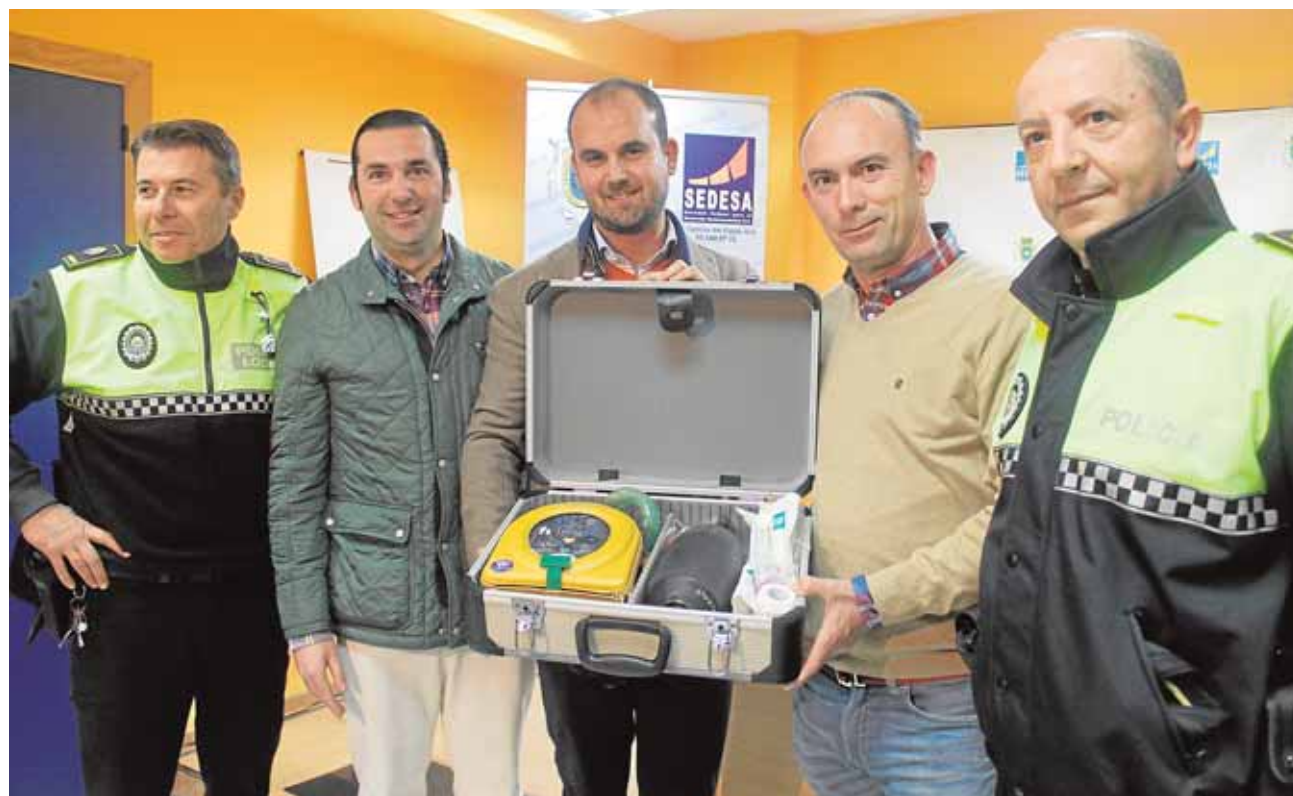
Agentes de Policía Local reciben el desfibrilador de manos del concejal de Seguridad y del gerente de Nevaluz A.L.

Una donación privada La Policía Local suele acudir minutos antes que los sanitarios y puede revertir un paro cardíaco