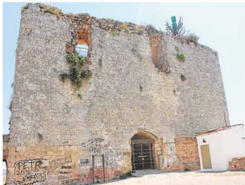
La Torre del Homenaje vuelve a estar cerrada

El día 20 de junio el Castillo de las Artes tendrá su último acto cultural