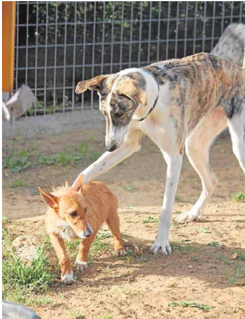
Sansa juega con otro perro poco antes de su viaje a Estados Unidos DDEVIDA