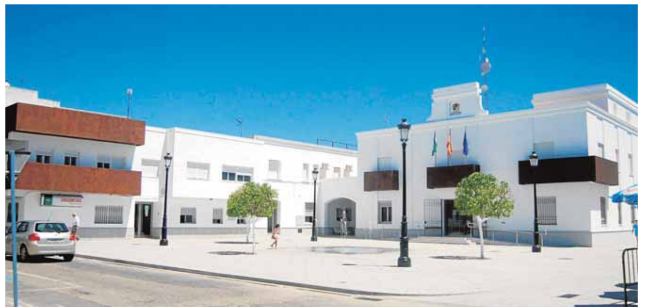
El Ayuntamiento de Tocina presenta una nueva imagen mientras culminan los trabajos en la Plaza de España. J.C.R.

Los espacios diáfanos y la luz natural centran una reforma que pone fin a los característicos despachos