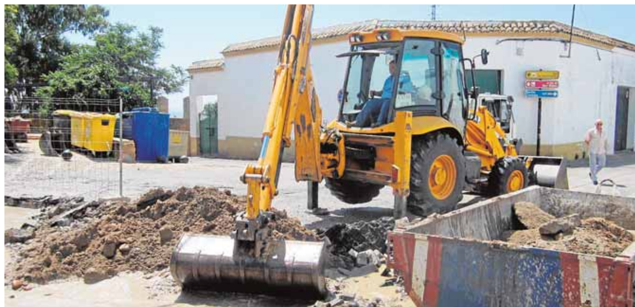
Las obras se realizarán en varias fases para reducir los problemas de tráfico que ocasionarán

La obra tendrá también una importante repercusión económica para la localidad, ya que a lo largo de su ejecución dará empleo a más de setenta personas desempleadas del municipio. La actuación se realizará mediante las programaciones anuales del Plan de Fomento del Empleo Agrario (PFOEA), que financian el Ayuntamiento, la Diputación Provincial y el Ministerio de Empleo. Esta iniciativa supondrá a lo largo de este año y del próximo una inversión de 1,8 millones de euros en mejora de calles, plazas, edificios y monumentos de la localidad.